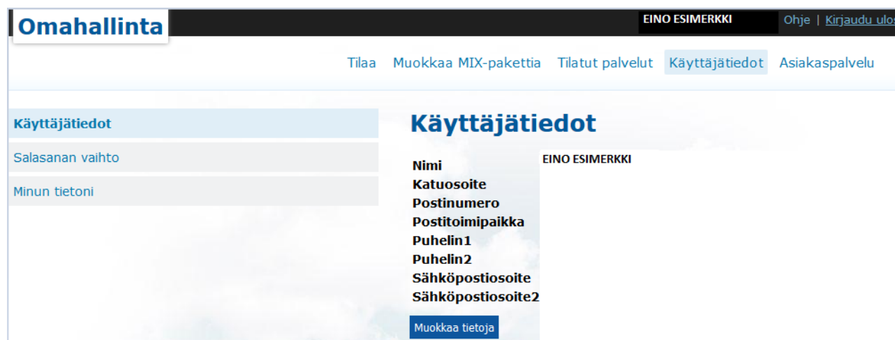
Kuva 2. Perusnäkömä palvelusta

Käyttäjätiedot tulevat oletusarvoisesti palvelua tilatessa annetuista tiedoista, mutta voit muokata osaa tiedoista valitsemalla Muokkaa tietoja , täyttämällä tarpeelliset kentät ja painamalla Talenna . Jos haluat muuttaa jotakin tiedoista, etkä sitä pysty tekemään, ota yhteyttä asiakaspalveluun Asiakaspalvelu -välilehdeltä löytyvillä yhteystiedoilla tai yhteydenottoaavakkeella. Voit vaihtaa kyseisen tilin salasanaa Salasanan vaihto -sivun kautta. Ota huomioon, että tämä muuttaa ainoastaan pääkäyttäjän tunnuksia, joilla kirjaututaan Omahallintaan; sähköpostitilien salasanat ovat erillisiä ja omien käyttäjätunnustensa alaisia.