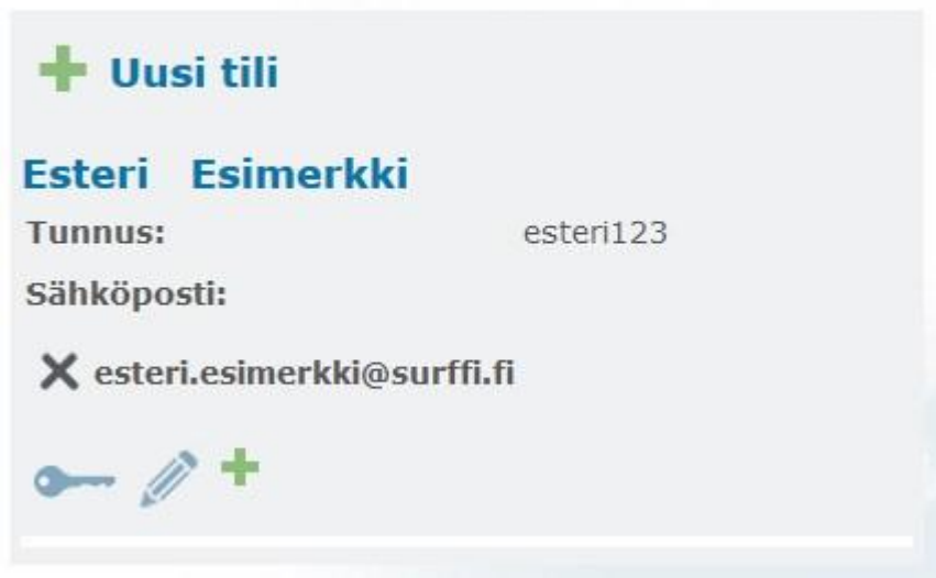
Kuva 3. Sähköpostitilien hallinta